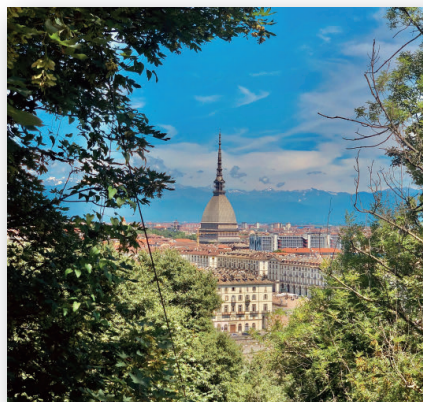
“Un luogo di silenzio in città”